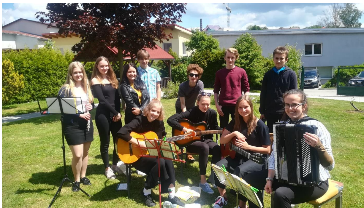
KONCERT POD OKNY oceněný jako SKUTEK ROKU