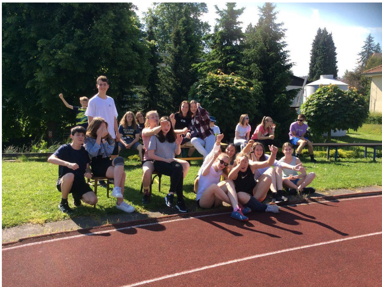
Fotografie z atletického dne v červnu 2021 po návratu do škol